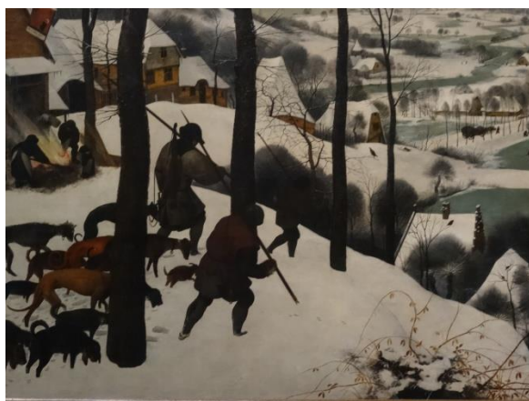
« les chasseurs dans la neige »- P Brueghel l'Ancien

L'après midi sera consacrée à la visite du Kunsthistorisches museum . Rendez au musée à 15h 00, pour une visite jusque vers 18h00 . Les collections du musée issues notamment des anciennes collections impériales autrichiennes de la dynastie des Habsbourg rassemblent des œuvres allant de l'Antiquité égyptienne et grecque jusqu'au XVIIIe siècle dans le domaine des arts décoratifs, et de la peinture. Une collection fabuleuse de peintures et d'objets d'art.